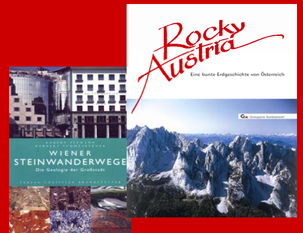
Geologie zum Nachlesen

Das Printmedium hat nach wie vor größte Priorität. Qualität (Druck, Layout, Bildmaterial, Text,...) überzeugt nachhaltig.