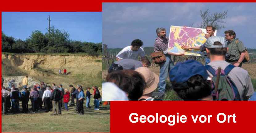
Geologie vor Ort

Das Printmedium hat nach wie vor größte Priorität. Qualität (Druck, Layout, Bildmaterial, Text,...) überzeugt nachhaltig.